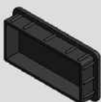
PONTEIRA INTERNA (BATOQUE) PP 3 mm 40 X 80 COD-BPI270