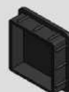
PONTEIRA INTERNA (BATOQUE) PP 3 mm 50 X 50 COD-BPI280