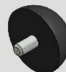
BATEDOR ESFÉRICO COM PARAFUSO 3/8" COD-RB038