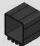
PONTEIRA EXTERNA 50 X 50 COD-BPI210