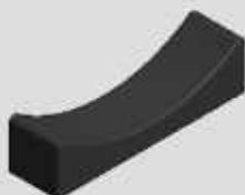
SUPORE PARA DUMBELL (MACIÇO) COD-RB380