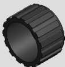
PONTEIRA EXTERNA REDONDA 2" COD-BPI252