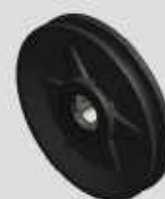
ROLDANA D130 COM ROLAMENTO COD-NL350