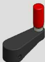
MANIVELA COM CABO GIRATÓRIO COD-MAN430