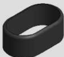
LUVA DE ACABAMENTO 55 X 100 COD-BPI500