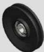
ROLDANA D113 COM ROLAMENTO COD-NL340