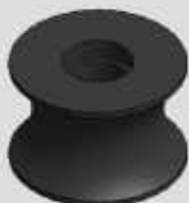
RODÍZIO PARA HASTE 3" INJETADO (US9620) COD-NL9620