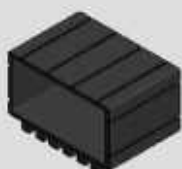
PONTEIRA EXTERNA 40 X 80 COD-BPI240